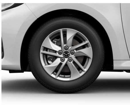
JANTE DIN ALIAJ DE 15 - 185/65 R15