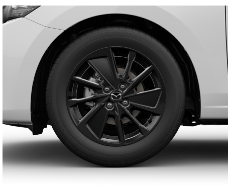
JANTE ALIAJ 16 NEGRE CU PNEURI 185/60 R16