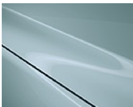
ALBASTRU AIR STREAM