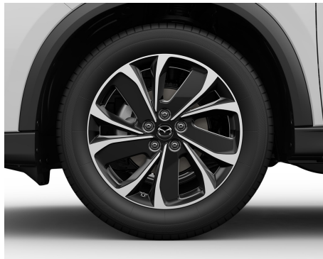
JANTE ALIAJ DE 19 NEGRE - 225/55 R19